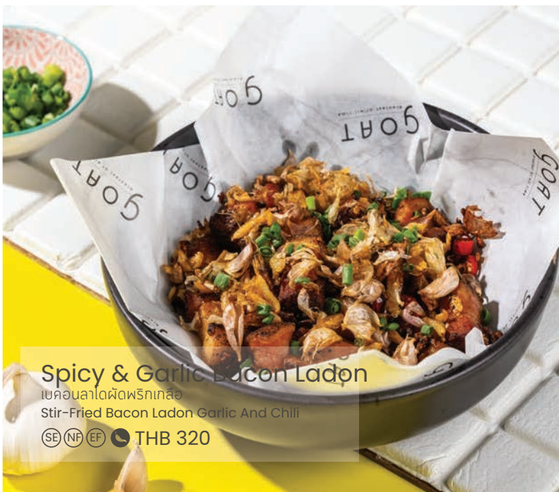
Spicy & Garlic Bacon Ladon

เบคอนผัดพริกเกลือ Stir-Fried Bacon Ladon Garlic And Chili