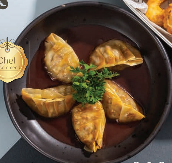
GOAT Dumpling (GO) (NF) (AL) เกี๊ยวแพะนึ่งซอสไวน์แดง THB 290