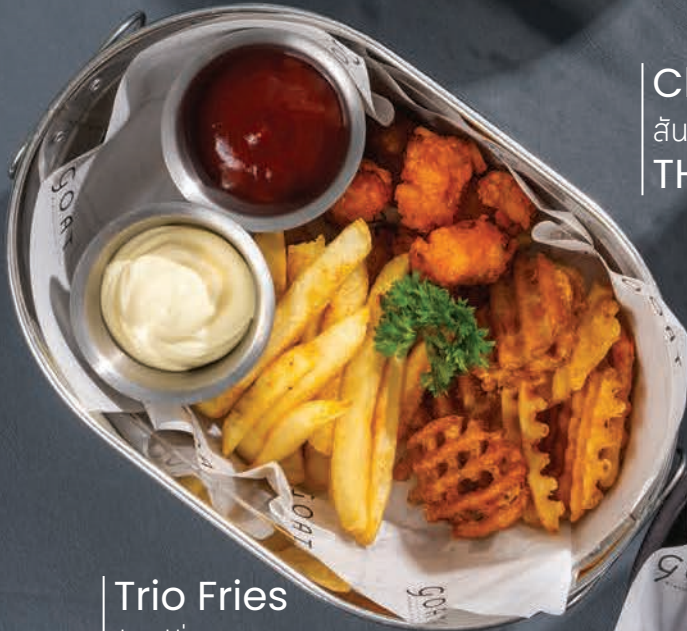
Trio Fries มันฝรั่งรวมทอด THB 220