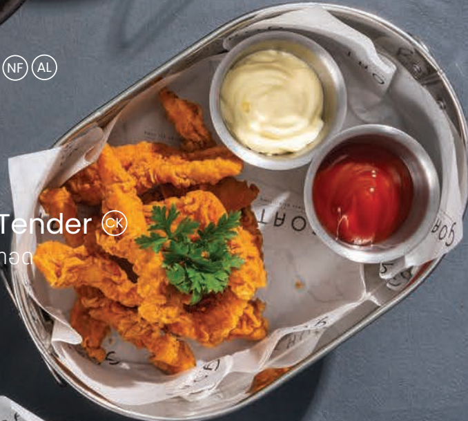
Chicken Tender (CK) สันในไก่ชุบแป้งทอด THB 250