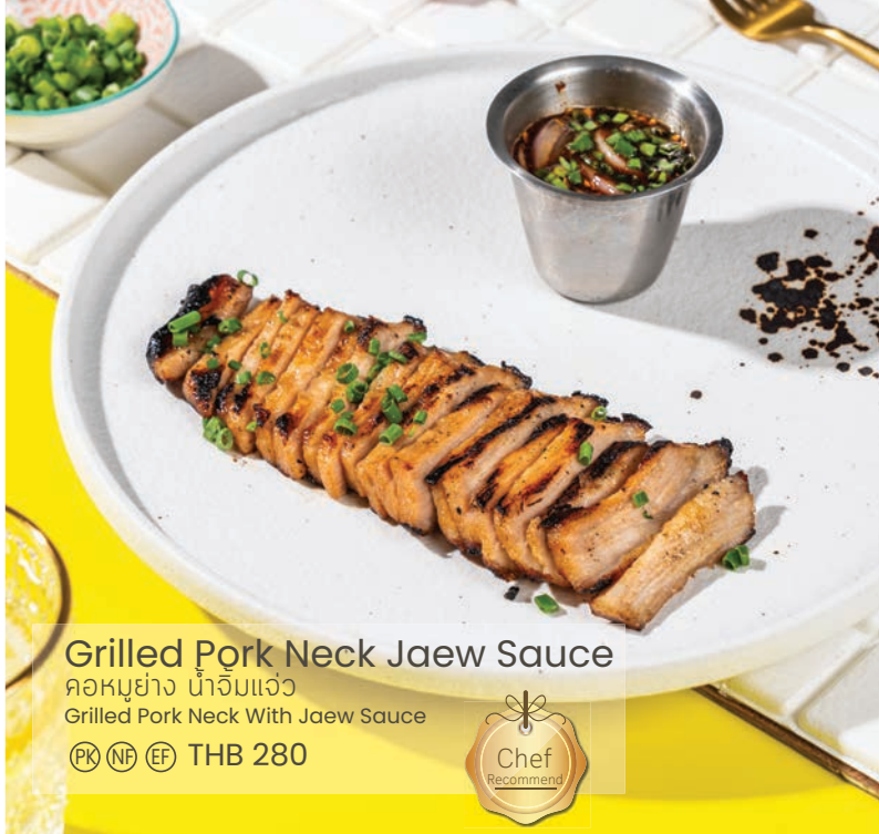
Grilled Pork Neck Jaew Sauce

คอหมูย่าง น้ำจิ้มแจ่ว Grilled Pork Neck With Jaew Sauce