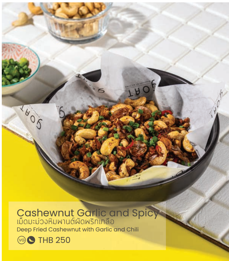
Cashewnut Garlic and Spicy

เม็ดมะม่วงหิมพานต์พริกเกลือ Deep Fried Cashewnut with Garlic and Chili