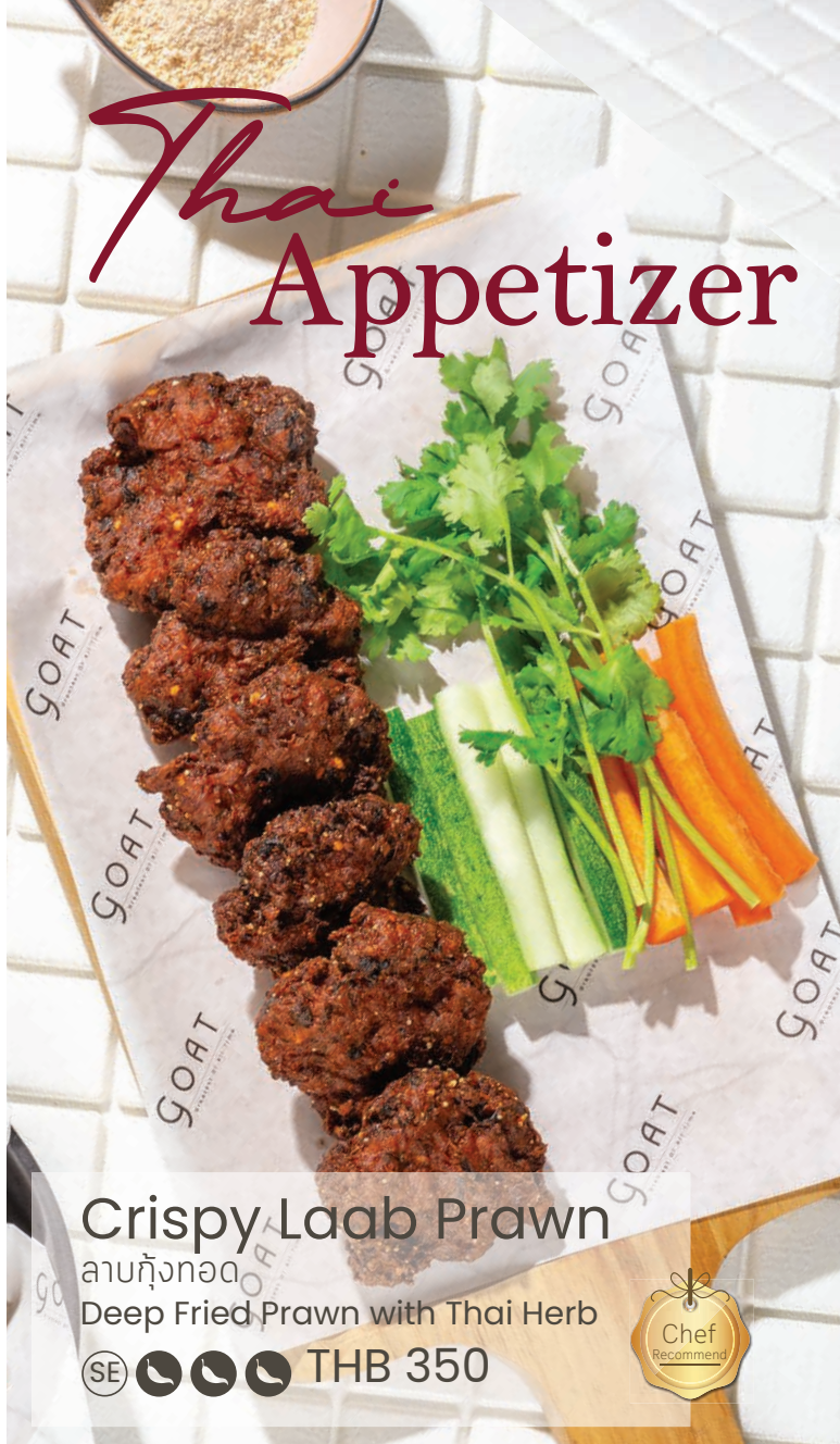
Crispy Laab Prawn

ลาบหุ้งทอด Deep Fried Prawn with Thai Herb