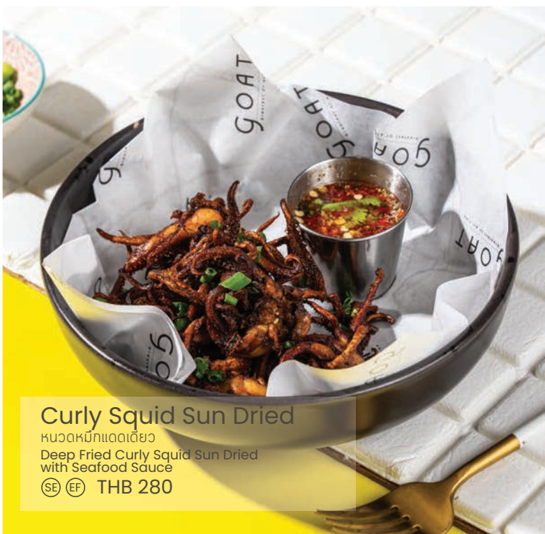
Curly Squid Sun Dried

หอยากหมึกแดดเดียว Deep Fried Curly Squid Sun Dried with Seafood Sauce