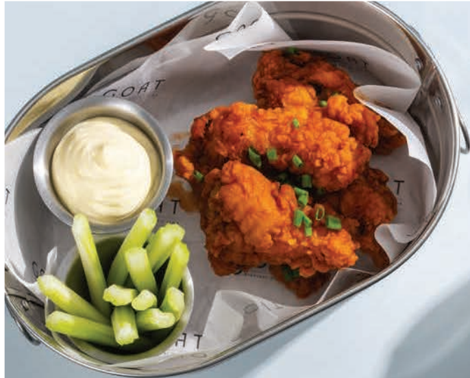
Buffalo Wings (CK) (S) ปีกไก่ทอดซอสบัฟฟาโล THB 350