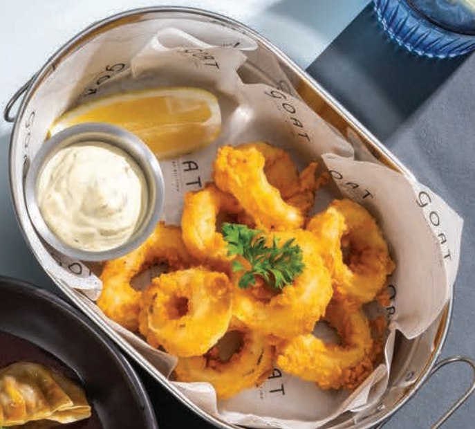
Calamari (SE) หมึกชุบแป้งทอด THB 320